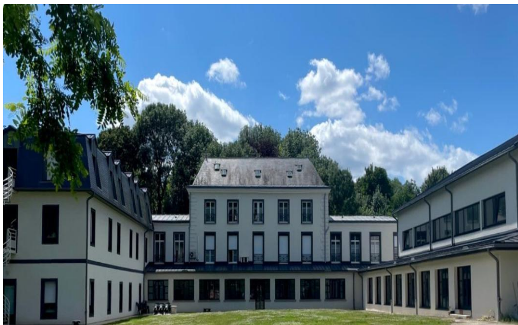
Monastère de l'Annonciade 38 rue J-F Marmontel (courrier) 91 rue du Pavé de Grignon (entrée) 94320 Thiais