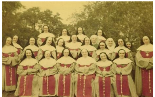
Communauté de Thiais hier